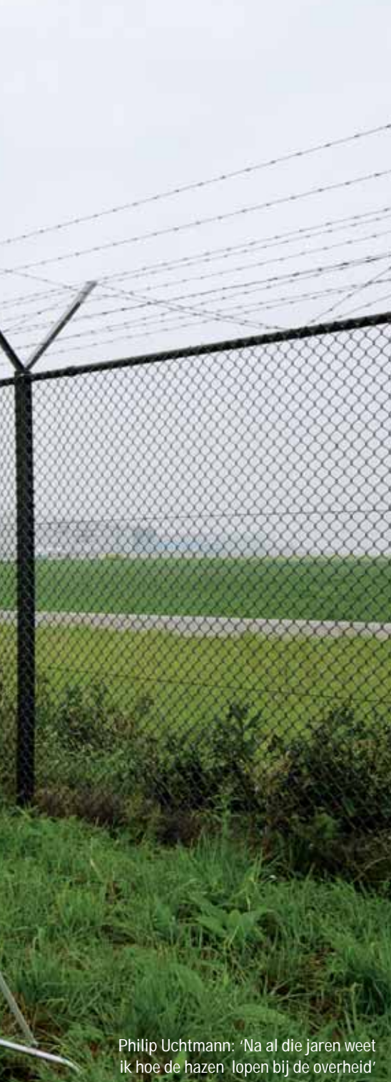
Philip Uchtmann: 'Na al die jaren weet ik hoe de hazen lopen bij de overheid'